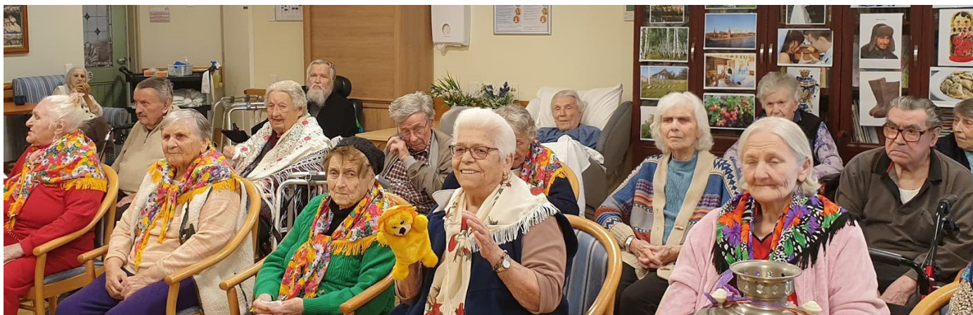
Праздник русской культуры