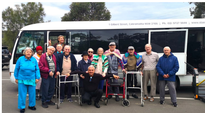
Готовы к путешествию