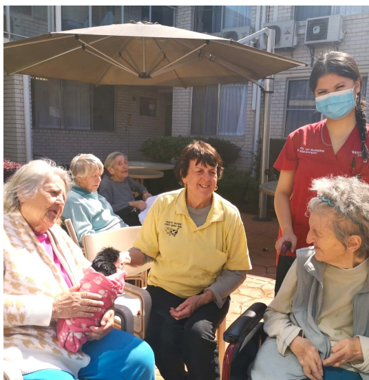
Маленькие животные в гостях у наших резидентов