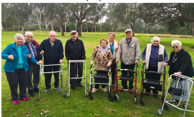
Поездка в парк