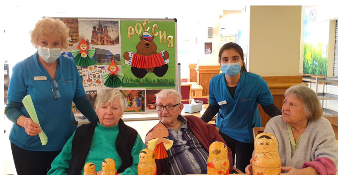
День русской культуры