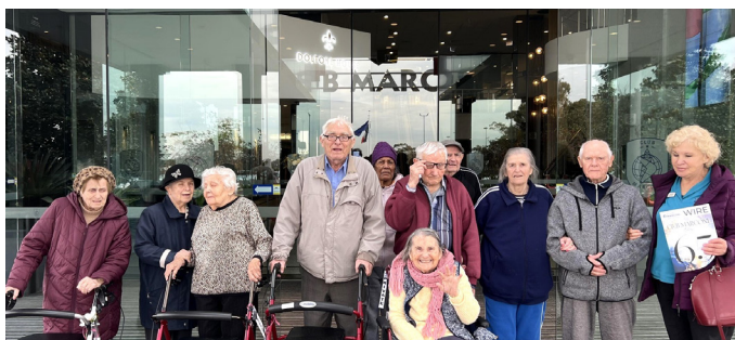
Поездка в клуб

Всегда приятно смотреть на веселье пожилых людей. Здесь, в РБО, одним из приоритетов является обеспечение того, чтобы резиденты интересно проводили время. Поэтому для них организуют не только экскурсии, небольшие путешествия, но и поездки в клубы, где их радуют новая обстановка, общение и сытный обед.