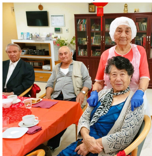
U zabavnom raspoloženju