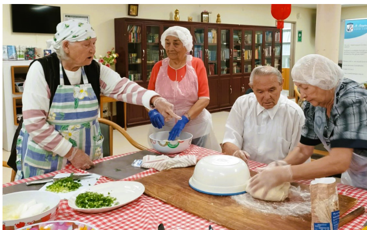
Knedle za kuvanje

Zapravo, ceo proces postaje ne samo rutina, već kreativni proces koji svakoj osobi omogućava da doda svoj deo magije malo parceli 'dobrice' upakovani u malo testa koje simbolizuje njihove specifične želje za srećom, zdravljem i bogatstvom. Logičan zaključak proslave je srećno okupljanje oko trpezarijskog stola, uživanje u knedlama uz pratnju zabavnih priča, šala i smeha.