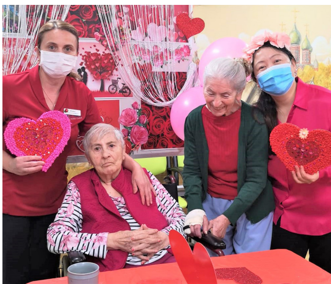
Proslava Dana zaljubljenih