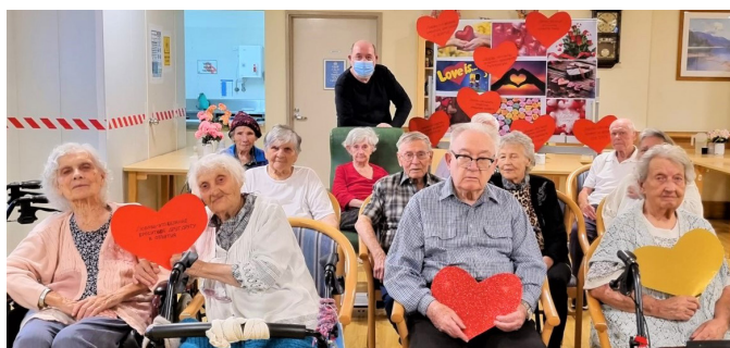
Predavanje o Danu zaljubljenih