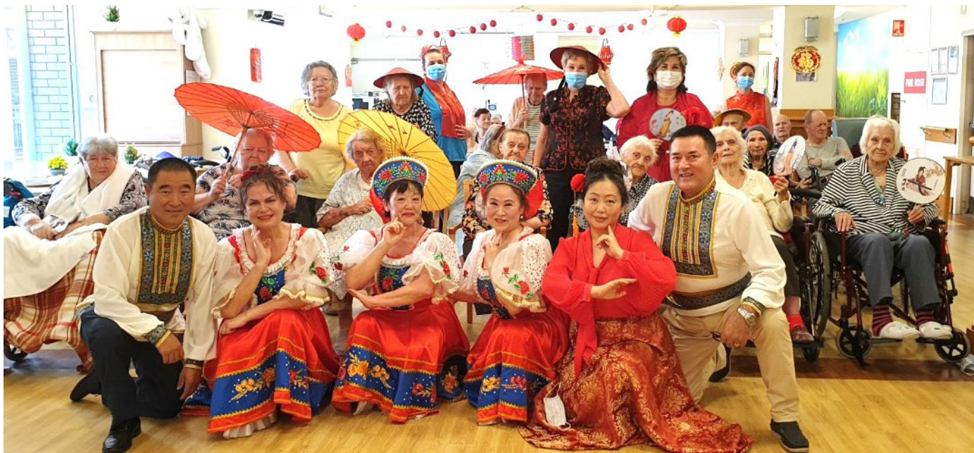
Proslava Kineske Nove godine