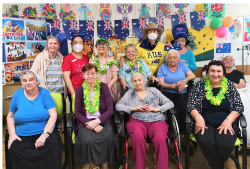
Proslava Dana Australije