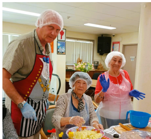
Kuvanje sa zadovoljstvom