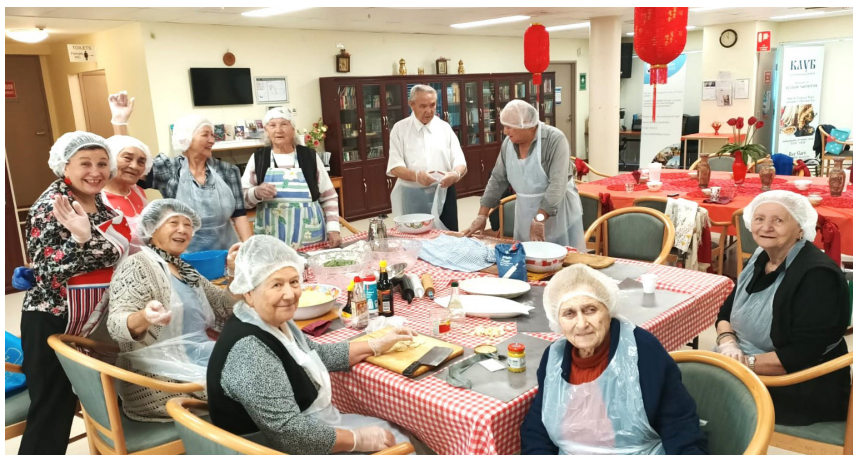
В кругу друзей