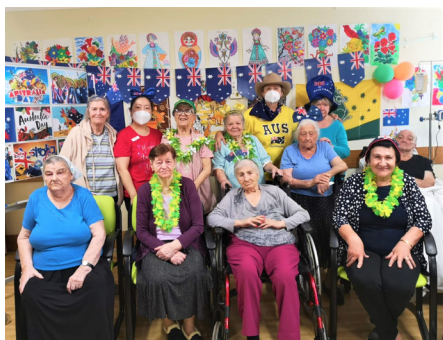
Празднуем День Австралии