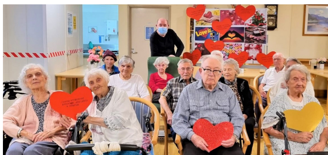
Беседа к Дню святого Валентина