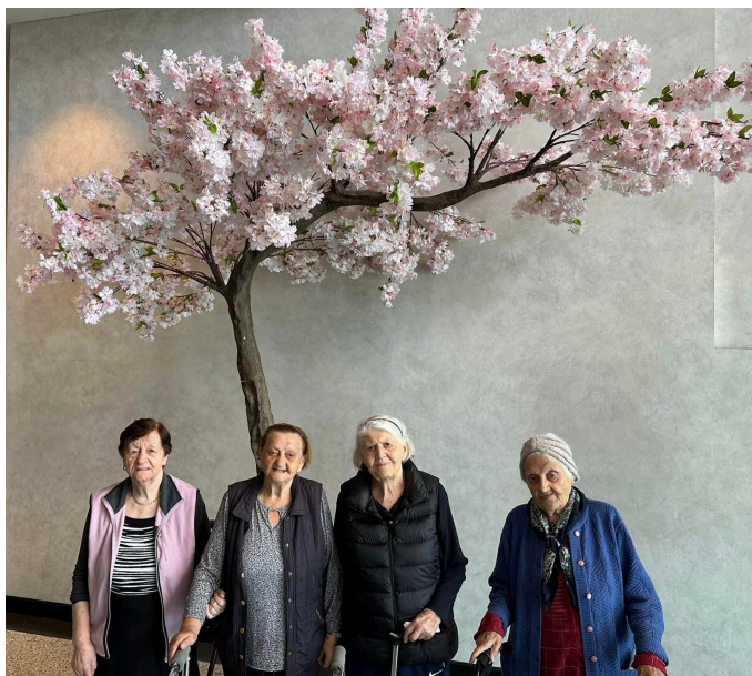
Наши дамы в клубе Маркони

Ежедневная жизнь резидентов должна быть комфортной, разнообразной и доставлять радость. Настольные игры развивают внимательность и память, кулинарные и художественно-декоративные классы – воображение и мелкую моторику, развлекательные мероприятия дарят положительные эмоции..