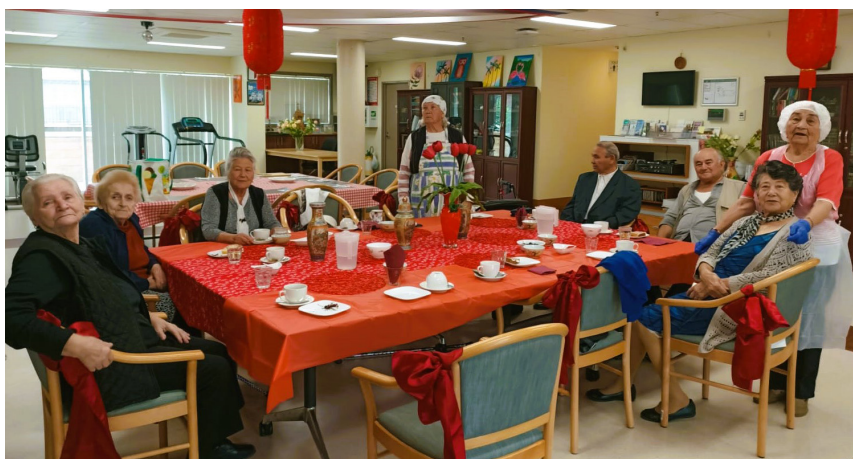
В ожидании чаепития