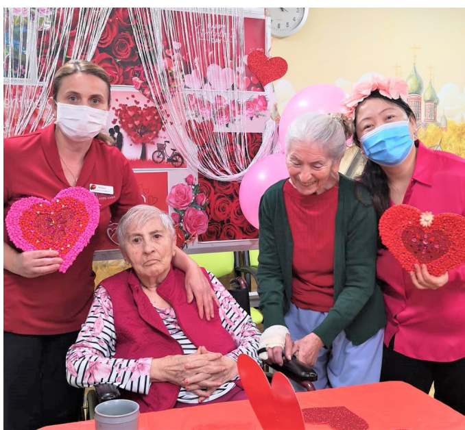
Празднование Дня святого Валентина