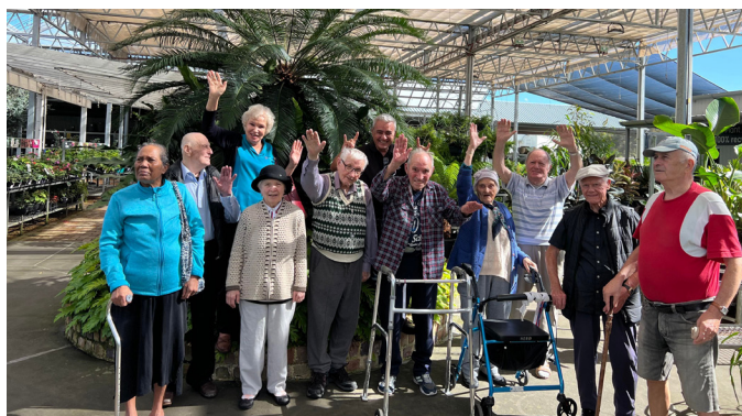
Flower Power posetioci