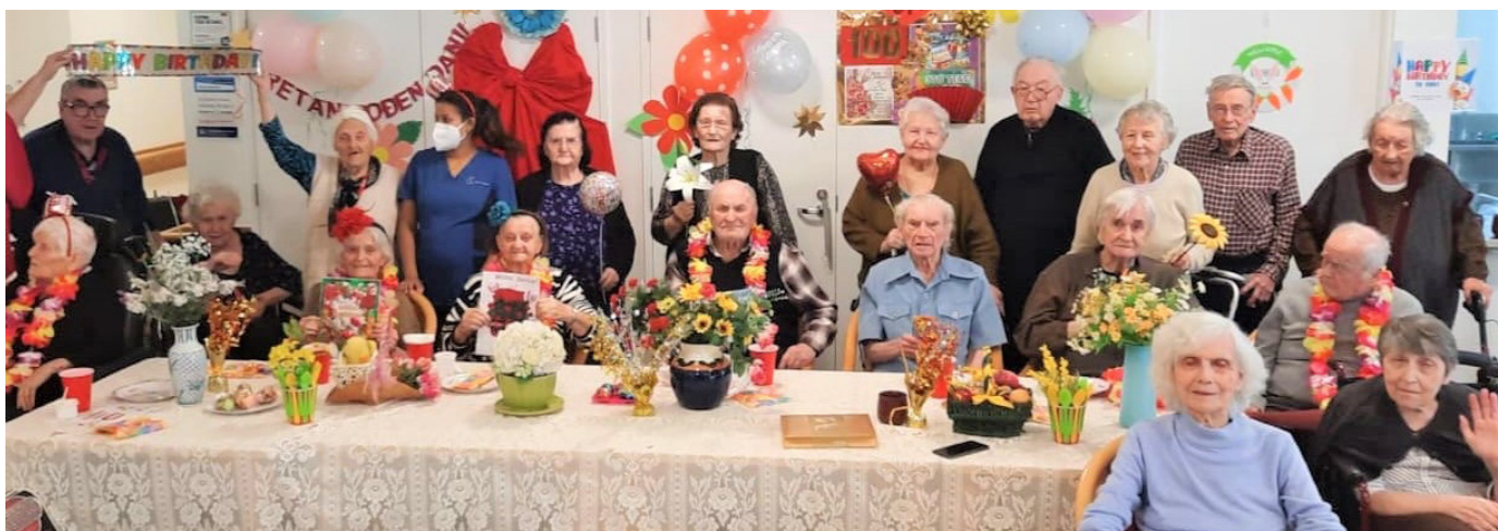
Zajednicka proslava rodendana