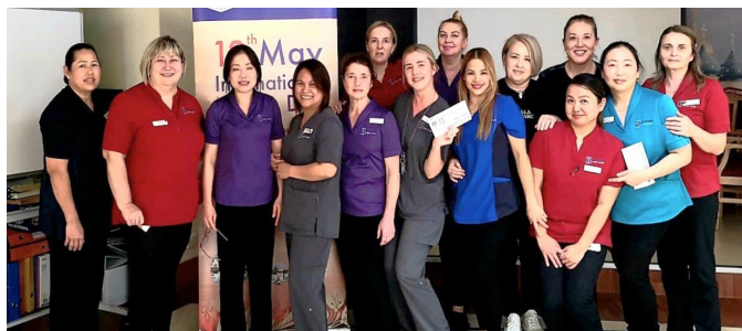
Proslava Dana medicinskih sestara

Medicinsko osoblje koje je zaposleno u Ruskom Domu, pored toga sto fizicki pomaze i brine za stanovnike Doma, takodje pruza psiholosku i emotivnu podrsku nasim starim i bolesnim stanovnicima Doma. Nase osoblje to radi u skladu sa profesijom i kvalifikacijom, dajuci svoj maksimum u nadi da