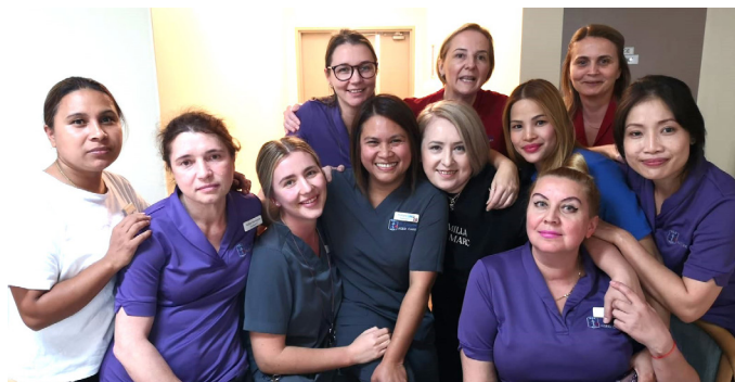
Nase medicinske sestre

ce stanovnici Doma imati ono sto zele i da im obogate dan.