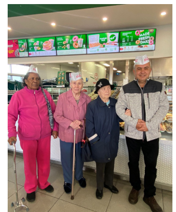
Putovanje u Krispy Kreme