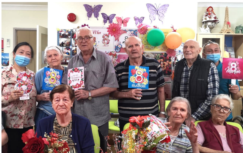
Medunarodni dan zena