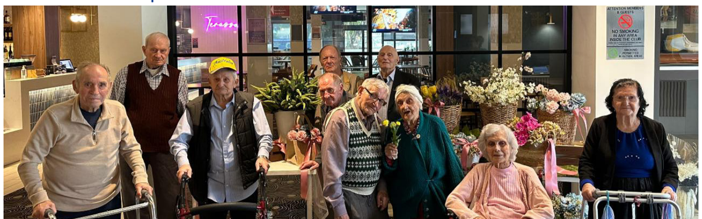
U srpskom klubu

Narocito prijatan dogadjaj i iskustvo se desilo kad su stanovnici Doma okupljeni i pozvani da posete Srpski Klub. Stanovnici Srpskog porekla koji su isli na ovaj izlet, su naravno bili presretni da budu u okruzenju koje je njihovog nacionalnog porekla i kad su svuda mogli da cuju svoj maternji jezik. Mnogi od njih su svojevremeno bili clanovi i posecivali Klub redovno a neki su naravno ucestvovali i u samoj izgradnji Kluba!. Za ostale, bilo je to prijatno iskustvo i zanimljivo da upoznaju drugu kulturu i da nauce nesto o toj kulturi.