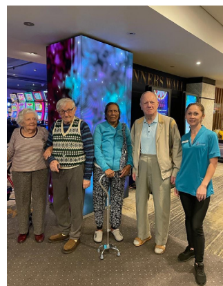
Putovanje u klub