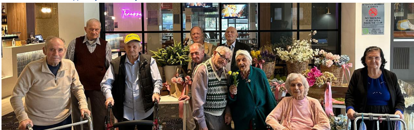
В сербском клубе

По-настоящему приятным событием стала поездка в сербский клуб. Группа собралась интернациональная. Сербские резиденты были счастливы оказаться в знакомом месте, где витает дух отчего края и повсеместно слышна родная речь. Для многих из них с клубом связаны приятные воспоминания: кто-то заходил сюда с родными, а кто-то принимал участие в его строительстве. Для резидентов других национальностей было интересно побывать в новом месте, прикоснуться к культуре Сербии и, конечно, разделить со всеми дружескую трапезу.