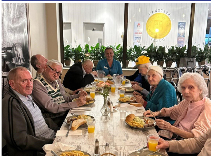
Обед в сербском клубе