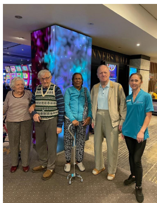
Поездка в клуб