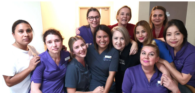
Медицинские сестры РБО

ухода. У всего медперсонала есть одна общая черта — непоколебимое стремление изменить жизнь людей к лучшему. Поэтому на празднике, посвященном Международному дню медицинской сестры, администрация РБО тепло поздравила сотрудников и вручила денежные призы победителям конкурса Лучший медицинский работник года.