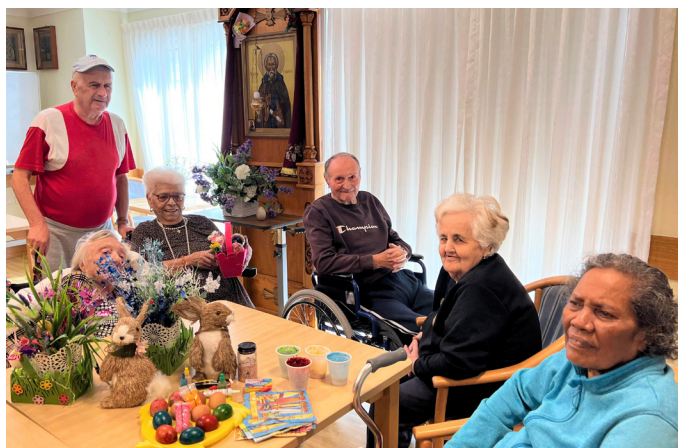
Подготовка к Пасхе

Сотрудники РБО поздравили жителей со Светлым днем и в качестве праздничных подарков преподнесли всем шоколадных зайцев.