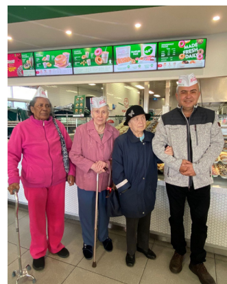
Поездка в Krispy Kreme