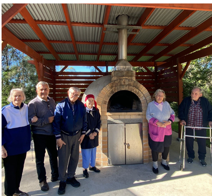
В Casula Powerhouse